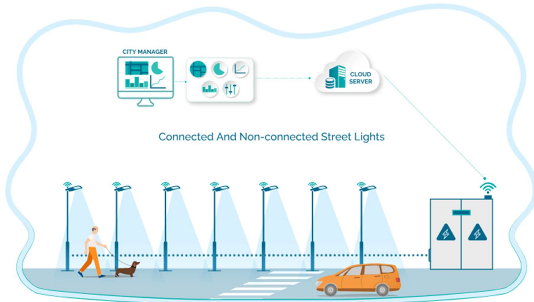
Slika 1. Slikoviti prikaz sustava vanjske rasvjete

Planovi predstavljaju podloge za projekte vanjske rasvjete i izradu Akcijskog plana. Bitno je razvoj rasvjete usmjeriti i uskladiti s zakonom o zaštiti od svjetlosnog onečišćenja. Najvažnije komponente vanjske rasvjete koje bitno utječu na provedbu zakona prikazani su na slici ispod.