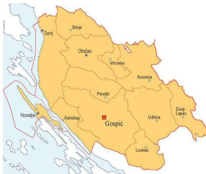
Slika 1. Smještaj Grada Gospića unutar Ličko-senjske županije

Grad Gospić po svom prostornom položaju u granicama Ličko-senjske županije zauzima dio njezinog središnjeg prostora, pri čemu svojim zapadnim rubom graniči s Gradom Senjom, sjevernim rubom s Općinom Perušić, istočnim rubom s Općinom Udbina, Općinom Lovinac i Općinom Plitvička jezera te južnim rubom s Općinom Karlobag. Područjem Gospića prolazi prometna infrastruktura državnog i županijskog značaja: željeznička pruga M604 za međunarodni promet Oštarije – Gospić – Knin – Split, državne ceste D-50, D-25 i autocesta Zagreb - Split, koje predstavljaju dio prometne okosnice od posebnog državnog značaja radi povezivanja središnjeg i južnog dijela Hrvatske. Takav položaj grada Gospića na trasama važnih cestovnih i željezničkih prometnih pravaca unutar Ličko-senjske županije pruža Gospiću povoljne predispozicije za održiv urbani razvoj i gospodarski napredak grada. Grad Gospić se prostire na površini od 966,87 km 2 , što čini 18,1% površine Ličko-senjske županije, čime se Grad nalazi na prvom mjestu po veličini u Županiji, ali i cijeloj Republici Hrvatskoj.